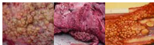
Pulmão bovino com lesões tuberculosas

Para maiores informações, procurar a Defesa Sanitária da região.